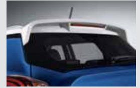
윙 스포일러 170,000원