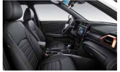
오렌지 인테리어(블랙 헤드라이닝)