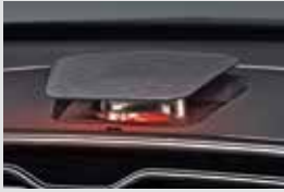
플로팅 무드 스피커 360,000원