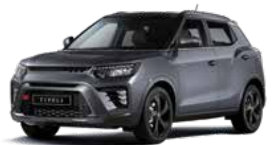
바디컬러/아웃사이드 미러 플래티넘 그레이 루프/리어 스포일러 블랙