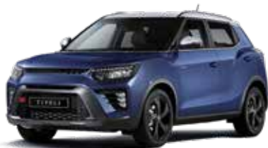
바디컬러 맨디 블루 루프/리어 스포일러/ 아웃사이드 미러 화이트