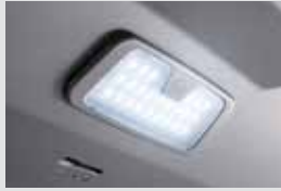
테일게이트 LED 램프 120,000원