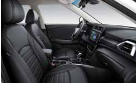
블랙 인테리어(그레이 헤드라이닝)