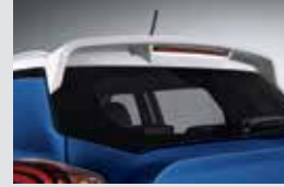
윙 스포일러 170,000원