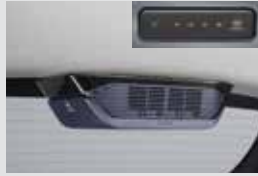
루프형 공기청정기 280,000원