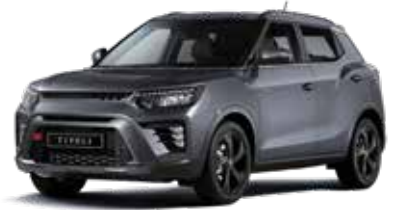
플래티넘 그레이 ADA