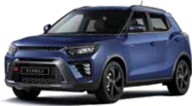
맨디 블루 BAS