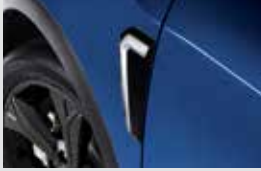
휀더 & 도어 가니쉬 270,000원