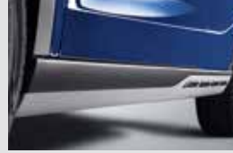
사이드 실 세트 250,000원