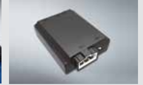
에어컨 습기 건조기 160,000원