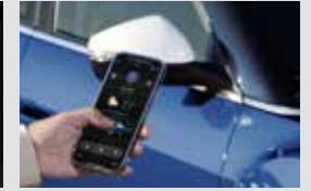
디지털 스마트 키 320,000원