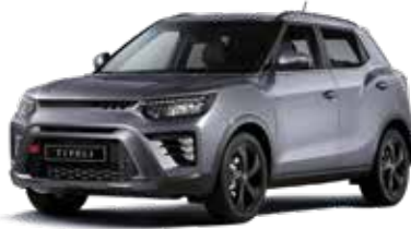
아이언 메탈 ADE