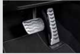
스포츠 페달 40,000원