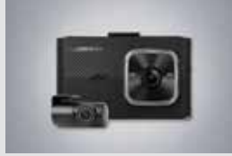
아이나비 블랙박스(16GB) 220,000원