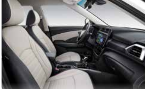
그레이 투톤 인테리어(그레이 헤드라이닝)