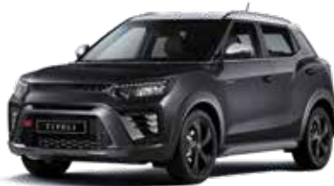
바디컬러 스페이스 블랙 루프/리어 스포일러/ 아웃사이드 미러 화이트