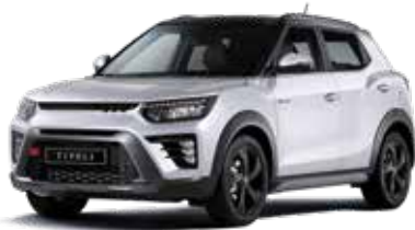
바디컬러/아웃사이드 미러 그랜드 화이트 루프/리어 스포일러 블랙