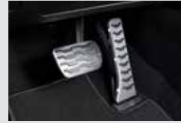
스포츠 페달 40,000원