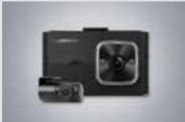
아이나비 블랙박스(16GB) 220,000원