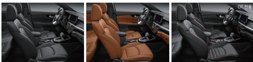
블랙 인테리어(가죽/인조가죽) 오렌지 브라운 인테리어(가죽/인조가죽) 블랙 인테리어(가죽/인조가죽)

※ 본 인쇄물에 수록된 사진의 색상은 인쇄 등 제작 과정을 거치며 실제 차량의 색상과 다소 차이가 발생할 수 있습니다.